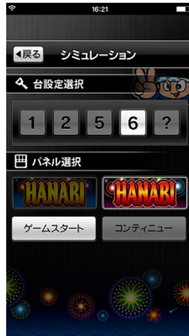
設定・パネル選択画面