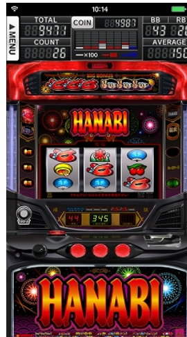
ボーナス確定画面 (マットブラック ver.)