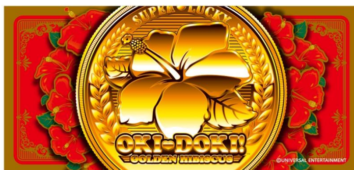
ゴールデンハイビスカス 30Φ ver.