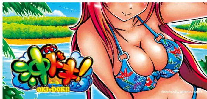
ラブリーガール 25Φ ver.

サイズ : 約 35cm×74cm 素材 : 新マイクロファイバー 価格 : 各 2,480 円(税込) 発送 : 本日より